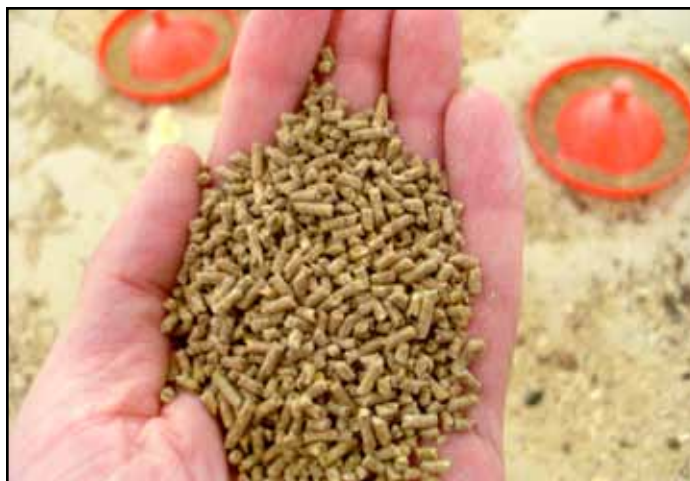
Схема 4: Образец корма высокого качества