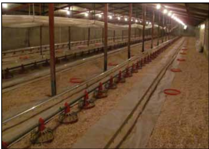
Схема 2: Образец оптимального оборудования птичника в начале производства.

Благодаря генетическому совершенствованию суточного мясного привеса, брудинговый период (первые 10 дней) теперь представляет почти 25% общего жизненного цикла птицы. Брудинговый период является критическим временем в развитии и активности функции кишечника, который способен эффективно усваивать корм. Создание верного температурного режима в этот период (Схема 2), поэтому, является критическим для общих производственных показателей и эффективности утилизации корма.