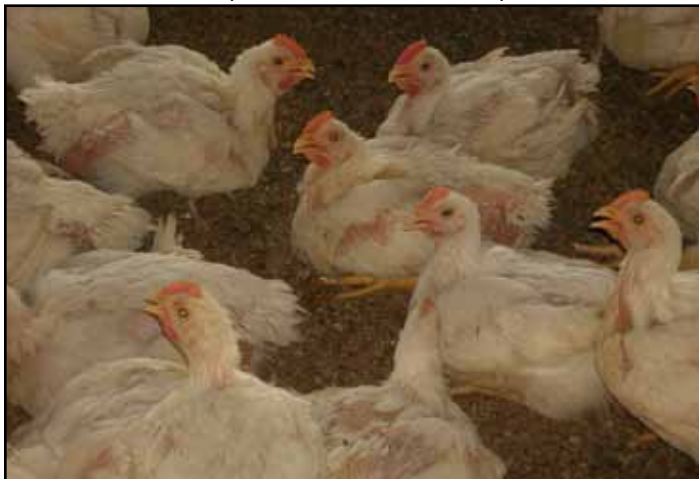
Схема 3: Птицы с признаками теплового стресса

проблемой, так как птице становится труднее выделять избыток тепла. Для компенсации этого необходимо снизить температуру по сухому термометру. Если относительная влажность слишком низкая, то температуру сухого термометра следует увеличить, чтобы создать птицам комфортные условия. Наблюдение за поведением птиц является наиболее эффективным способом контроля условий окружающей среды.